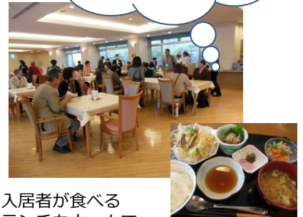
入居者が食べる ランチもホームで 試食します