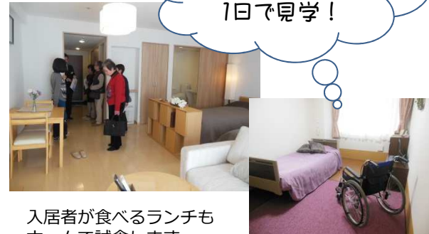
入居者が食べるランチもホームで試食します